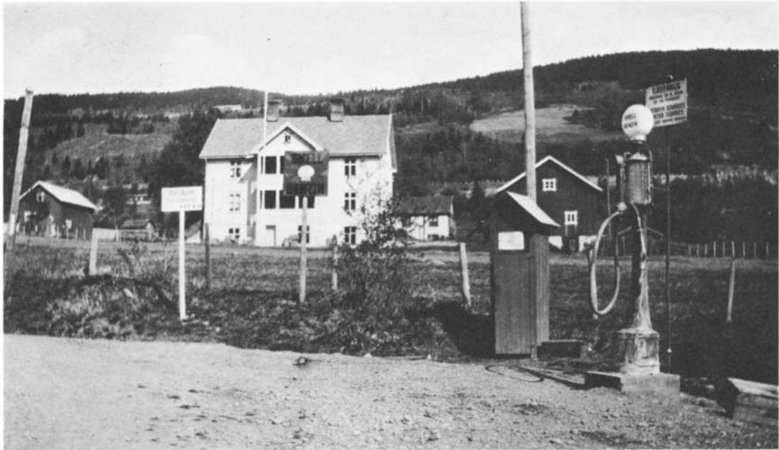
Bensinstasjonene var enkle saker den første tiden – dette er stasjonen på Fåberg i Oppland.

Var det riktig kaldt, måtte sjåførene ringe på forhånd slik at oljen kunne settes til oppvarming ved siden av en parafinbrenner.