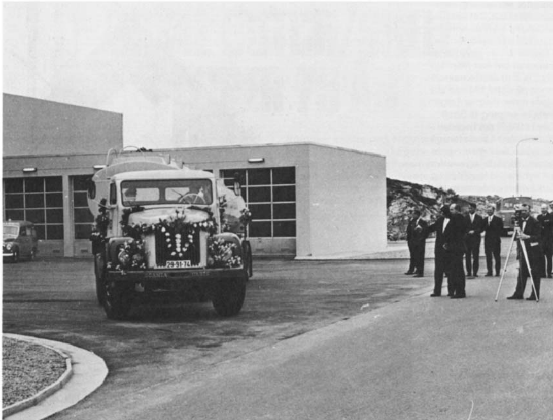
Den offisielle åpningen av raffineriet på Sola fant sted i april 1968.

Raffineriet på Sola ble bygget i midten av 60-årene. Den offisielle åpningen av raffineriet fant sted i april 1968.