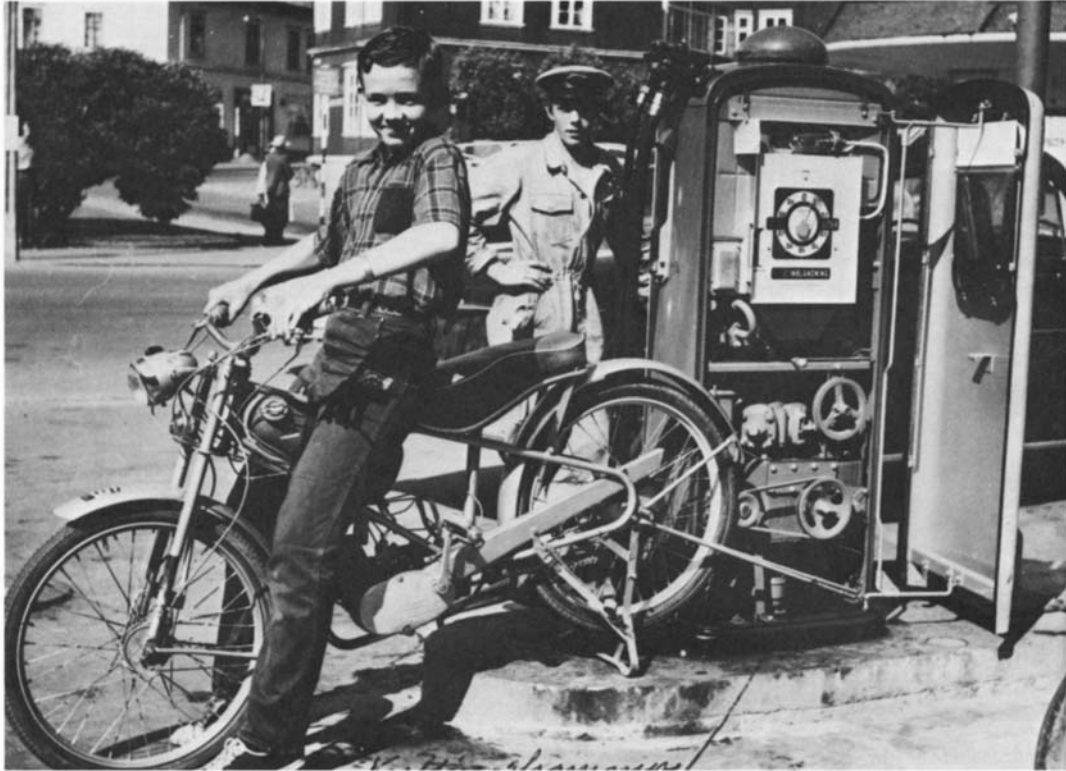
Gode råd var ikke dyre. Under strømrasjoneringen i midten av 50-årene fant man på råd. Man satte en moped til å drive pumpene.