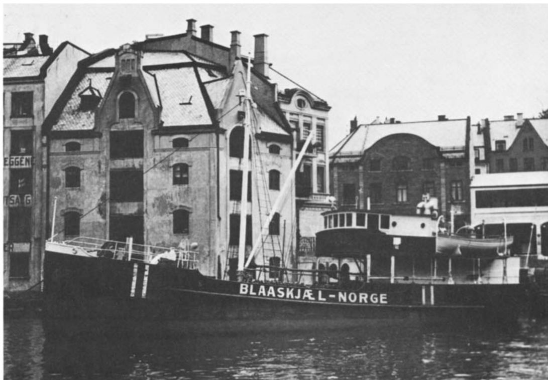
NEMAKs første tankbåt "Blaaskjæl" ved kai i Ålesund

For å forsyne de mange kystdepotene, måtte det også bygges båter. Den første båten Shell fikk bygget var "Blaaskjæl". Dette var allerede i 1914. Senere kom "Rødskjæl" og "Hvitskjæl" og en rekke andre bunkersbåter, lektere og etter hvert også nye kysttankere.