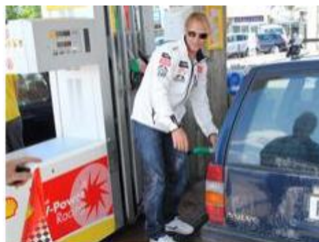
Petter Solberg fylte gratis FuelSave til svært fornøyde kunder på Shell stasjonen Torshov Bilistsenter.

Mange kom ut for å hilse på, og slå av en prat med den populære rally-kjører. Autografer ble villig delt ut, og flere gikk også til innkjøp av effekter fra Petter Solberg kolleksjonen fra stasjonen, som også ble signert på stedet.