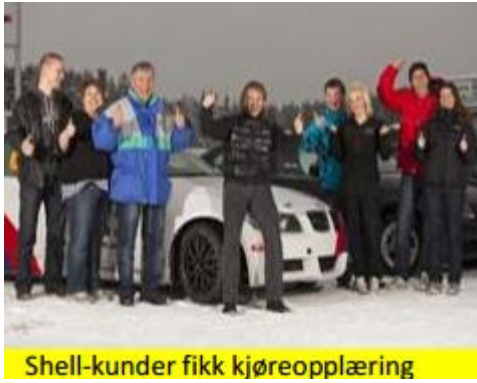
Shell-kunder fikk kjøreopplæring