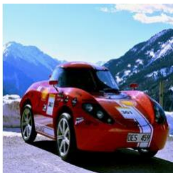
Den mest drivstoffgjerrige bil i Sverige ble produsert til Shell Eco-marathon

For deltakerlagene er bærekraftig mobilitet mer enn bare et moteord. Deltakerne i Shell Eco-marathon er fremtidens ingeniører og bidrar til å gjøre bærekraft til en realitet. Samfunnet trenger en ny generasjon talentfulle problemløsere til å takle verdens energiutfordringer, sier konsernsjef Peter Voser i Shell, som ser frem til årets konkurranse.